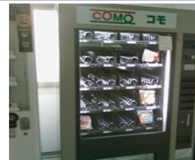
域内食品加工事業者と横・共同展開を目指す。