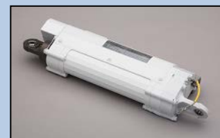
製造例) アクチュエータ