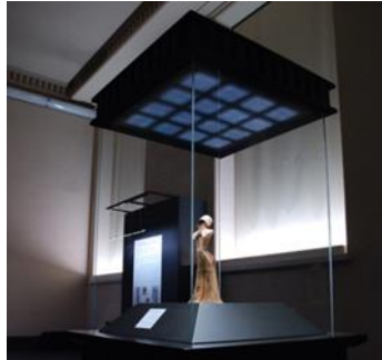
博物館展示ケース照明