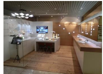
首都圏市場開拓拠点 「Organic LED YAMAGATA」 (OZONE・新宿)