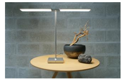
タスクライト「TAKE-TOMBO」 (ビジネスマッチング事例)